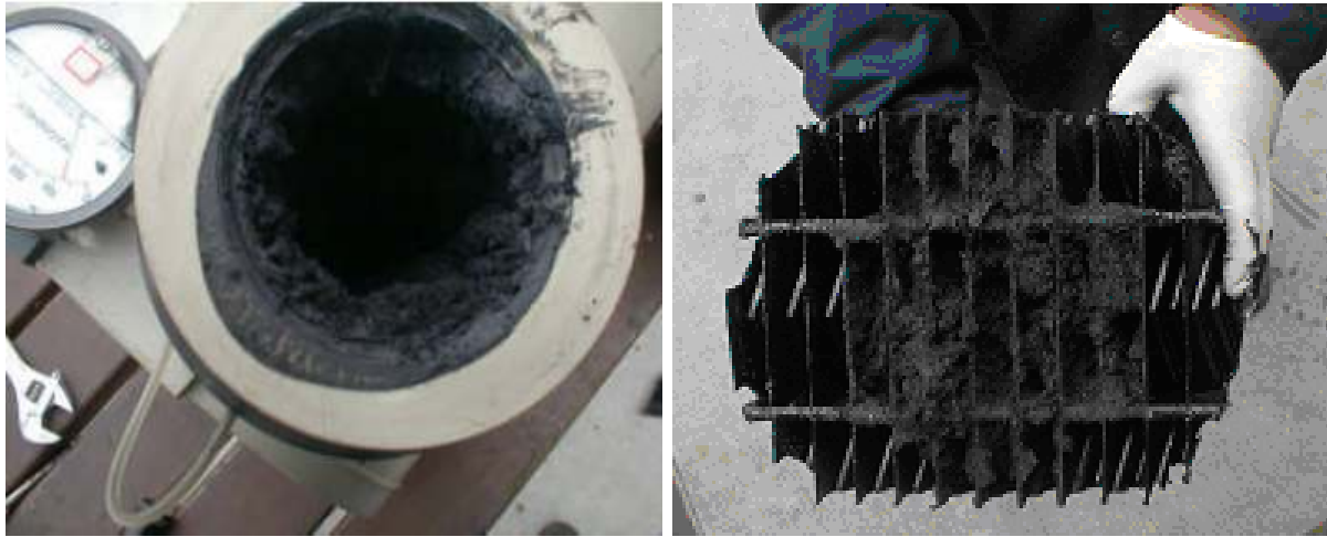
Рисунок 1 – Забруднення обладнання смолою [3]

Перед спалюванням генераторного газу в двигунах внутрішнього згорання, камерах згорання газотурбінних установок та в котлах, газ потрібно очистити від смол. За умов малої потужності установки, наявність очисного обладнання підвищує капіталовкладення в проект та збільшує експлуатаційні витрати. Тому найбільш доцільно встановлювати газогенератори, що виробляють газ з незначним вмістом смол. Слід зазначити, що в науковій літературі та інформації розміщеній на інтернет - ресурсах обмежена кількість даних по вмісту смол при газифікації різних видів альтернативних видів палив в залежності від типу газифікатора. Проведення широких експериментальних досліджень в даному напрямку та систематизація існуючої інформації є важливою науково-практичною задачею. Отримання газу з низьким вмістом смол в процесах газифікації є надзвичайно актуальною проблемою.