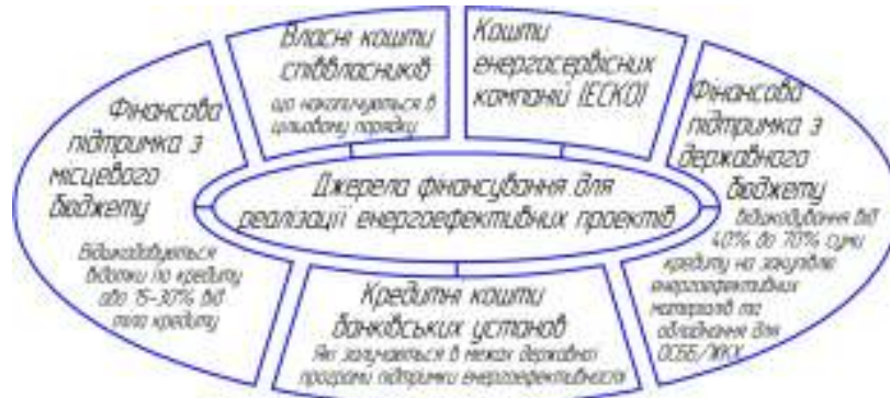
Рисунок 1 – Джерела фінансування енергоефективних проектів

Джерела фінансування заходів з підвищення енергоефективності будинку представлено на рис. 1. Вибір фінансового механізму залежить від: кошторисної вартості проекту та строків окупності; рівня платоспроможності співвласників; умов залучення позикових коштів від банківських установ, приватних інвесторів; умов надання міжнародних донорських грантових підтримок. Обирається варіант з мінімальним грошовим навантаженням на співвласника і мінімальним строком окупності.