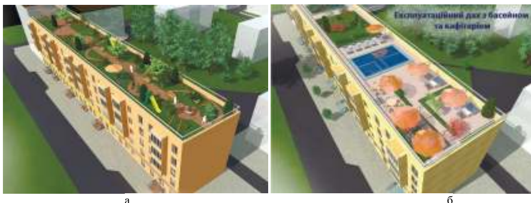
Рисунок 2 – Варіанти реконструкції та використання даху будівлі (м. Вінниця, Проспект Коцюбинського 35) а – використання плоскої покрівлі під озеленення та дитячі майданчики; б – експлуатаційний дах з басейном та кафетерієм

Використання подібного принципу забудови позитивно вплине на благоустрій міста. Забудова нетипових ділянок центральної частини міста