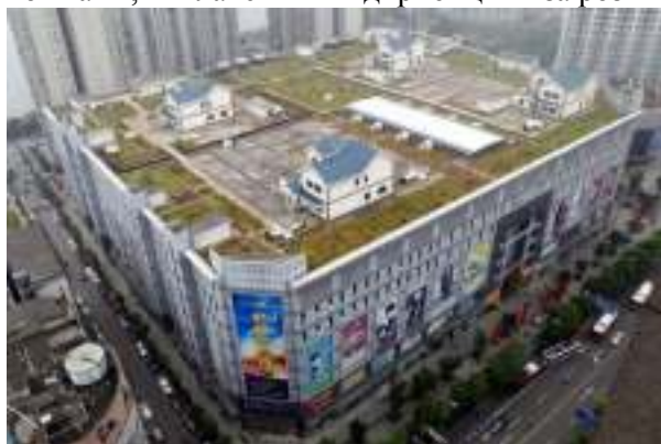
Рисунок 1а – Комфортабельні житлові вілли з прибудинковою територією, побудовані на даху торгового центру в Чжучжоу

– Використання нетипових ділянок для зведення житлового простору. Група дизайнерів Homeless Innovative, що знаходяться в Словаччині, розробили незвичайний проект для свого регіону. Вони зробили ескізи в електронному вигляді, і показали як з трикутної рекламної щитової установки зробити соціальне житло для потребуючої людини. Обслуговування будиночка ведеться за допомогою підводки міських мереж. А витрати на утримання будинку окуповується коштами, виплаченими підприємцями за розміщення реклами на біг-бордах (рис.1, г).