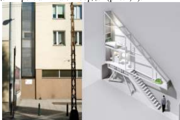
Рисунок 1б – Будинок побудований в Варшаві в провулку шириною 1 м