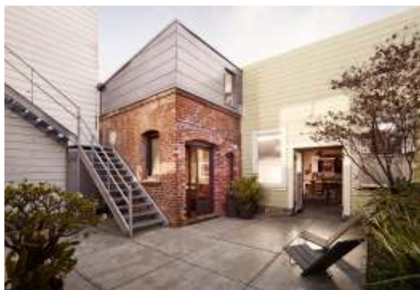
Рисунок 1в – Будинок з котельні Сан-Франциско