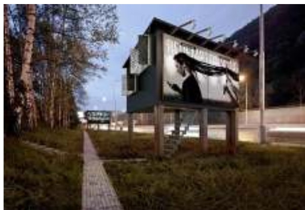
Рисунок 1г – Будинок на рекламному щиті – соціальний проект словацьких архітекторів