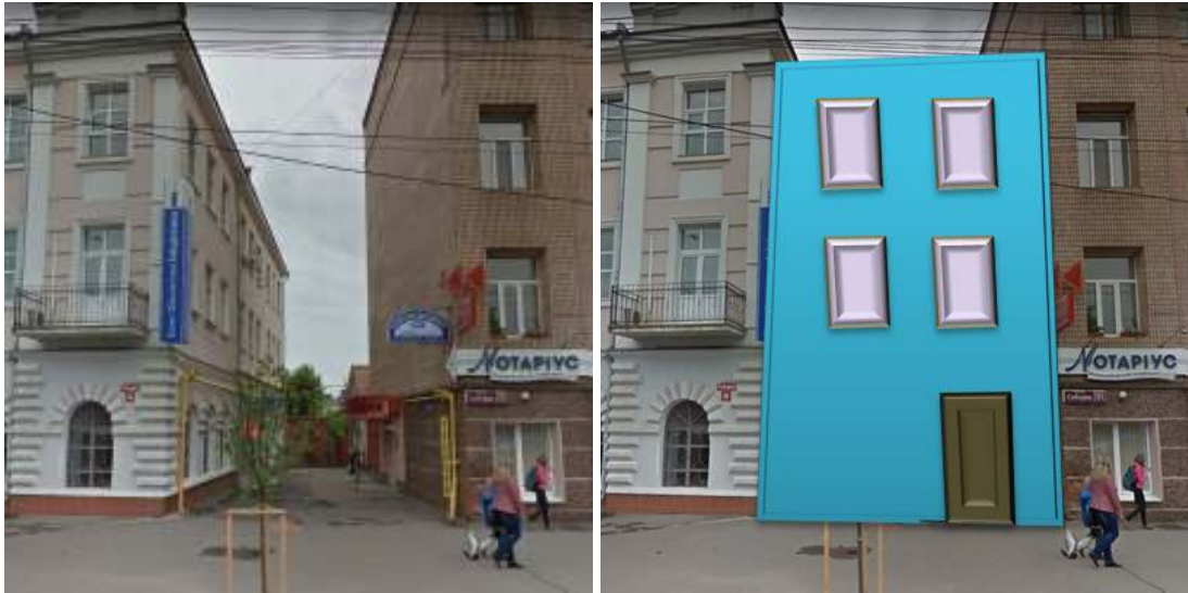
Рисунок 4 – Варіант прибудови по вул. Соборній