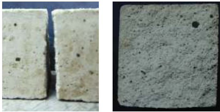
Рис. 1. Структура зразків-призм модифікованої сухої будівельної суміші на перлітовому заповнювачі