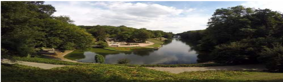
Рис. 3. Приклад пейзажного парку в місті Умані

Пейзажна схема (довільна) характеризується вільною сіткою плану, асиметрією, підпорядкуванням природньому рельєфу: вільнозвивистими доріжками, живописними формами водоймищ, пагорбів; широким використанням квіткового оформлення; наявністю пейзажних картин. На рис. 3 показаний пейзажний парк в м. Умані «Софіївка».