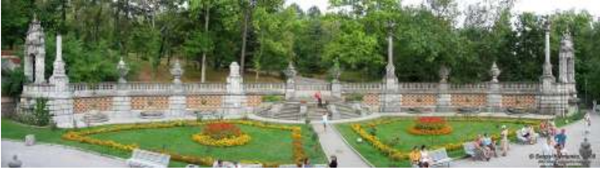
Рис. 2. Приклад регулярного парку у Криму

Відповідно до планувальної схеми садово-паркові об'єкти поділяються на регулярні, пейзажні та змішані. Регулярна схема характеризується регулярною сіткою у плані, головною композиційною віссю, яка орієнтується на доміную, строгістю композиції: чіткість пропорцій, ритмом елементів, симетрією членування, геометричною конфігурацією майданчиків. На рис. 2 показаний приклад регулярного парку у Криму.