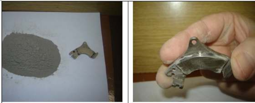
Рис. 3. Вихідні матеріали для оцінки магнітних властивостей і вилучення магнітних фракцій із золи-винесення