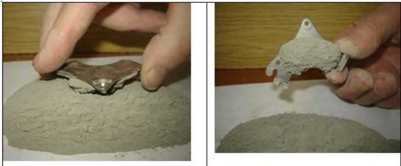
Рис. 4. Візуальна оцінка вмісту оксидів заліза в складі золи – винесення Ладижинської ТЕС

На рис. 3 показана вихідна зола-винесення і магніт, які були використані для оцінки магнітних властивостей золи-винесення. Як видно з рис. 4 на поверхні золи - винесення залишився «кратер», що свідчить про те, що частинки заліза через його магнітні властивості притягують і частину діелектричної складової золи-винесення.